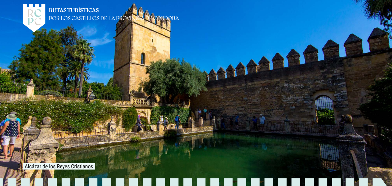
Alcázar de los Reyes Cristianos