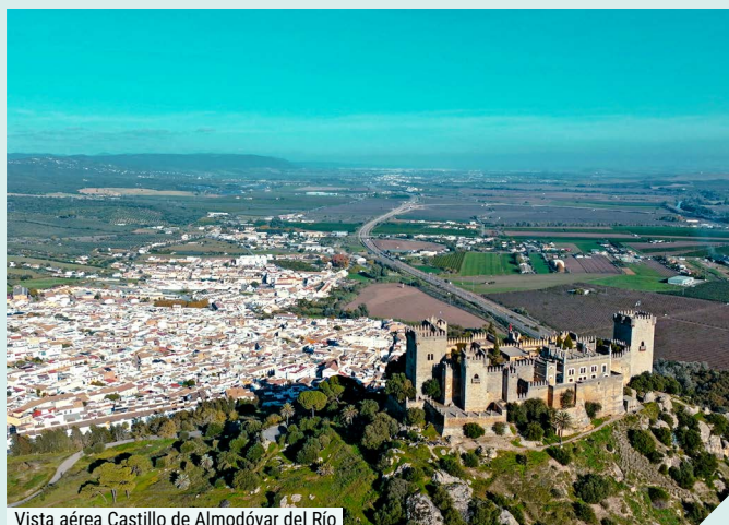
Vista aérea Castillo de Almodóvar del Río