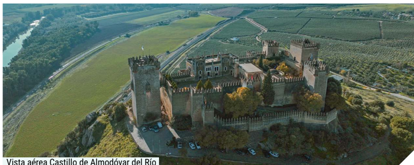
Vista aérea Castillo de Almodóvar del Río