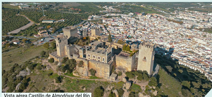
Vista aérea Castillo de Almodóvar del Río

Cena en taberna cordobesa típica recomendada.