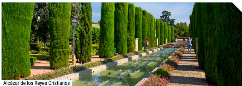
Alcázar de los Reyes Cristianos