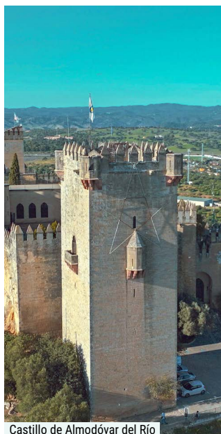
Castillo de Almodóvar del Río