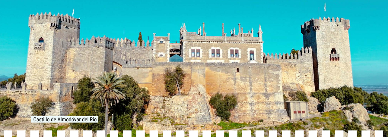
Castillo de Almodóvar del Río