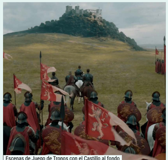
Escenas de Juego de Tronos con el Castillo al fondo