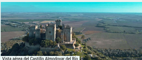
Vista aérea del Castillo Almodovar del Río