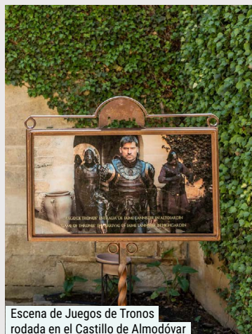
Escena de Juegos de Tronos rodada en el Castillo de Almodóvar

A tan sólo veinte minutos de Córdoba, se alza majestuosa una de las fortalezas más imponentes de Europa: el Castillo de Almodóvar del Río , que data del S. VIII y moldeado por siglos de historia, conquistas y culturas. No es casualidad que haya sido elegido como escenario de grandes producciones como Juego de Tronos o Camelot, porque este castillo no solo guarda historias, sino que las inspira.