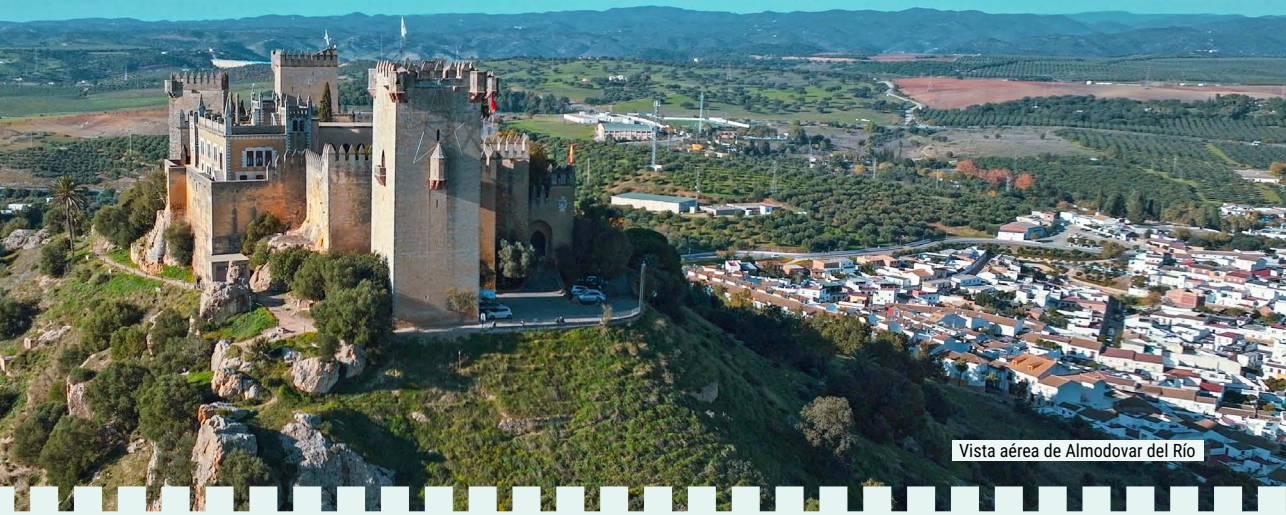
Vista aérea de Almodovar del Río