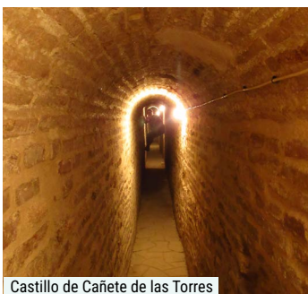
Castillo de Cañete de las Torres