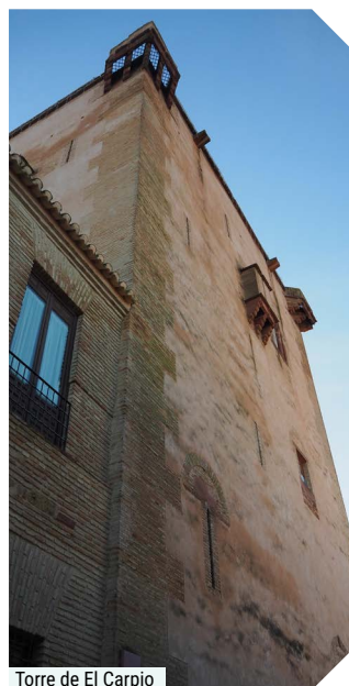
Torre de El Carpio