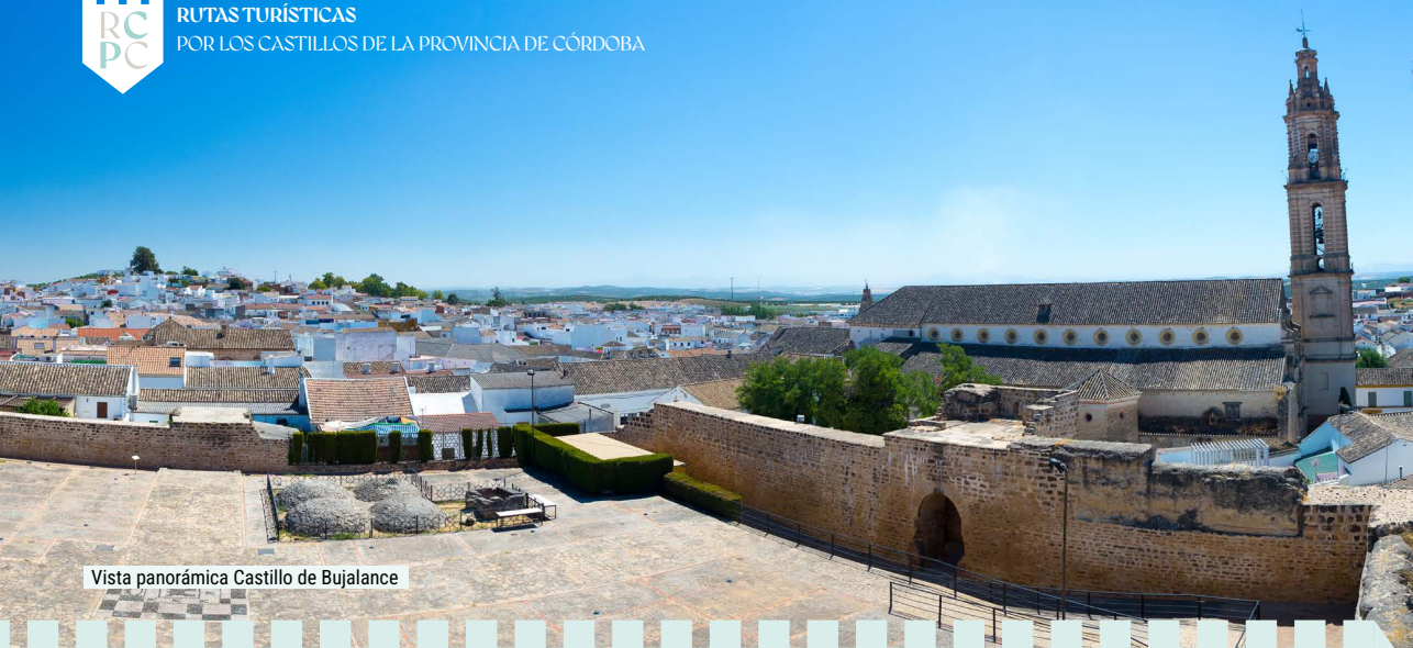
Vista panorámica Castillo de Bujalance