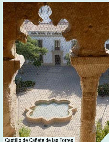
Castillo de Cañete de las Torres

Nos despediremos con una comida en un restaurante de la localidad, donde la cocina tradicional se eleva, con un diseño que te sorprenderá.