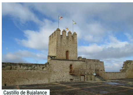
Castillo de Bujalance