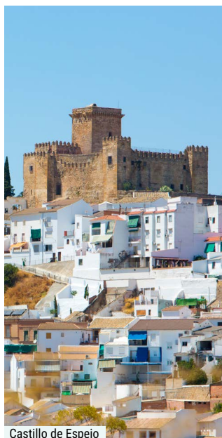
Castillo de Espejo