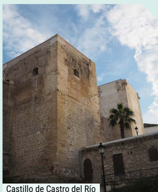
Castillo de Castro del Río

Abandonaremos Torreparedones, aún sobrecogidos por su belleza, para llegar al casco urbano de Baena, donde el cultivo del olivar dibuja su paisaje y moldea su cultura. Nos sorprenderá su Museo Arqueológico e Histórico, que salvaguarda un legado con sorprendentes piezas y esculturas, procedentes del origen