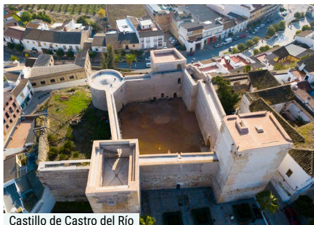
Castillo de Castro del Río