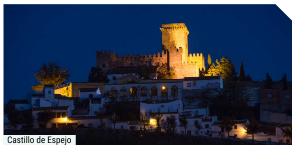
Castillo de Espejo