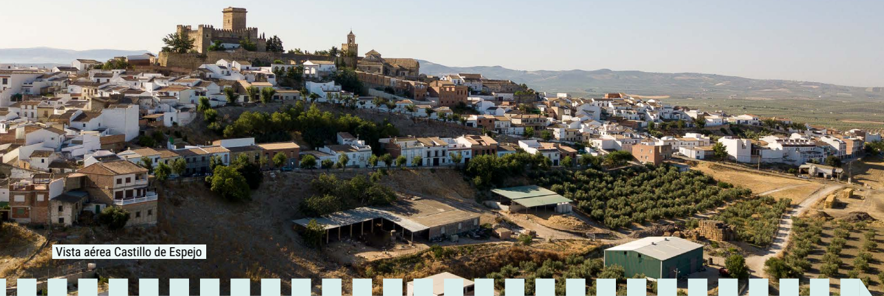
Vista aérea Castillo de Espejo