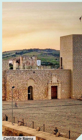
Castillo de Baena

Llegaremos a nuestro siguiente destino, Baena, donde, tras hacer el check-in en el alojamiento, disfrutaremos de una cena libre, con recomendaciones sobre las diferentes opciones que ofrece.