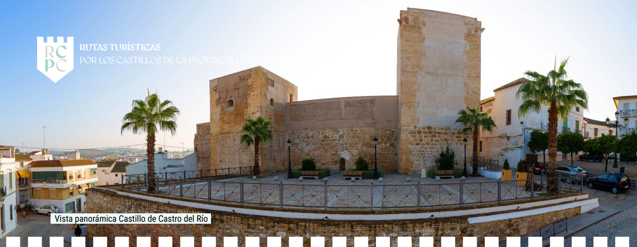
Vista panorámica Castillo de Castro del Río