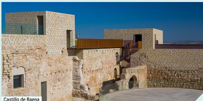
Castillo de Baena

Un almuerzo en Baena, aderezado con el extraordinario AOVE con DOP de Baena, cierra nuestra experiencia en la comarca de Guadajoz-Campiña Este.