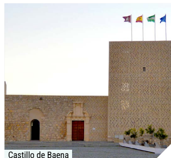
Castillo de Baena