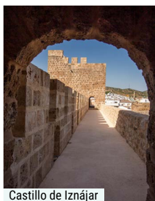
Castillo de Iznájar