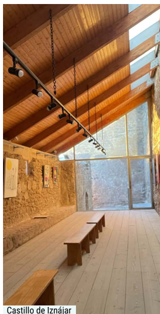
Castillo de Iznájar