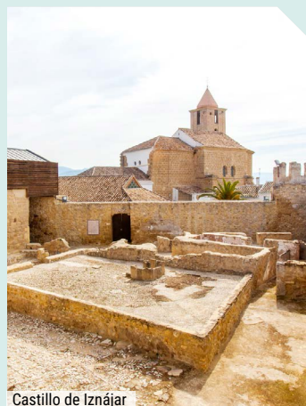
Castillo de Iznájar

Nos adentraremos en su castillo, fortaleza árabe reformada, datada de los S. XIII y XIV. Nos sorprenderá su imponente Torre del Homenaje de 30 metros de altura, declarada Monumento Histórico-Artístico Nacional desde 1943. Fue levantada por la Orden de Calatrava entre los años 1245 y 1327.