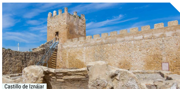
Castillo de Iznájar