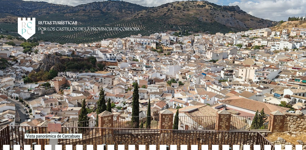
Vista panorámica de Carcabuey