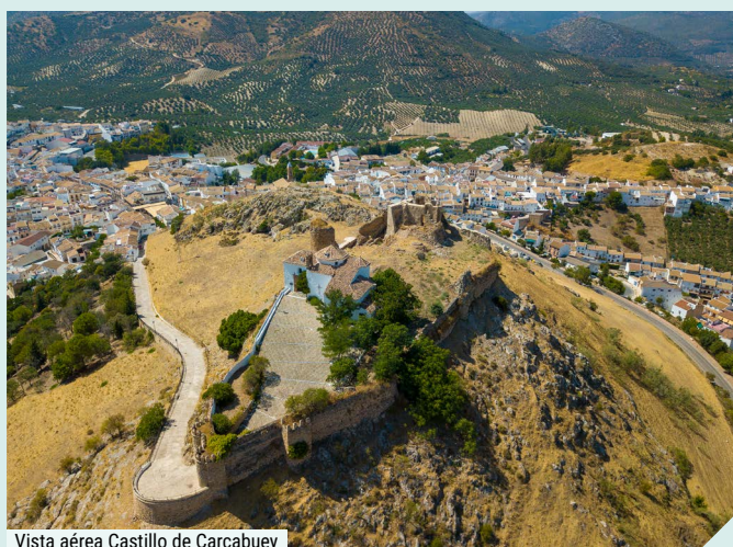
Vista aérea Castillo de Carcabuey