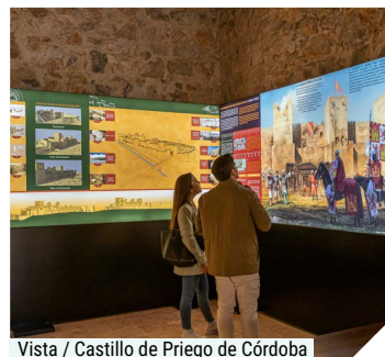
Vista / Castillo de Priego de Córdoba