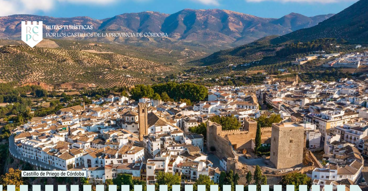
Castillo de Priego de Córdoba