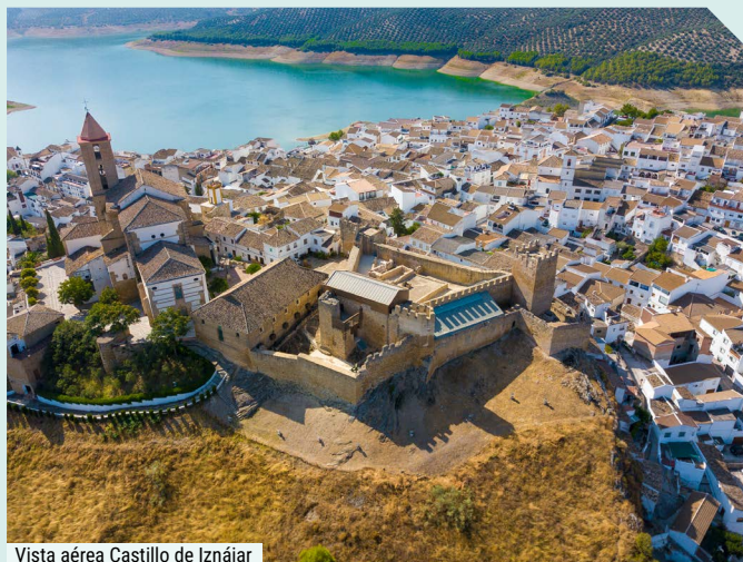
Vista aérea Castillo de Iznájar