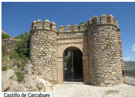
Castillo de Carcabuey