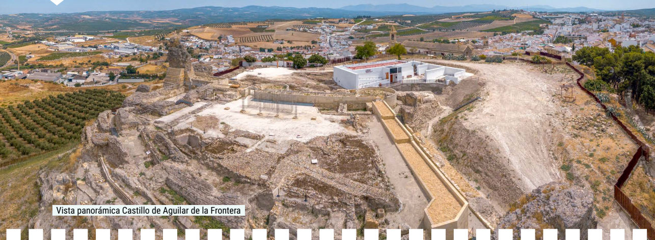
Vista panorámica Castillo de Aguilar de la Frontera