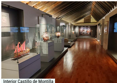
Interior Castillo de Montilla