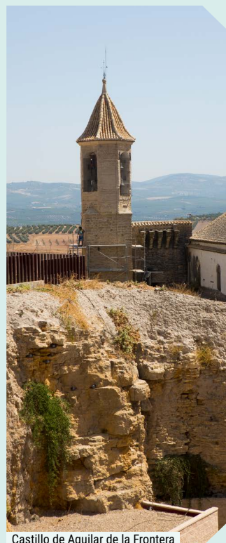
Castillo de Aguilar de la Frontera

Cerramos la mañana con un menú en un restaurante local, maridado con vinos D.O.P. Montilla-Moriles y aceite de oliva virgen extra.