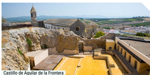
Castillo de Aguilar de la Frontera