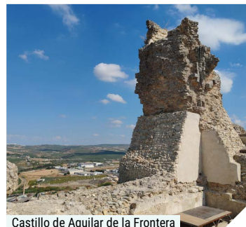
Castillo de Aguilar de la Frontera