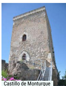
Castillo de Monturque