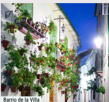
Barrio de la Villa

Antes de abandonar el casco antiguo, nos adentraremos en el Barrio de la Villa , el alma blanca de Priego, declarado Conjunto Histórico-Artístico . Un laberinto de calles estrechas, de fachadas blancas adornadas con flores, donde el tiempo parece haberse detenido. Pasearemos entre plazas recoletas, fuentes y rincones silenciosos que guardan el eco del pasado andalusí.