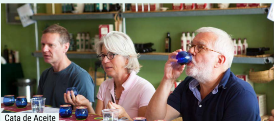
Cata de Aceite