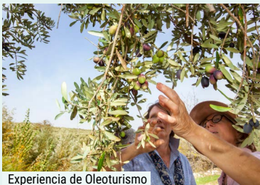
Experiencia de Oleoturismo