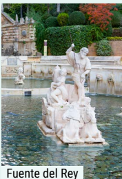
Fuente del Rey