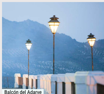
Balcón del Adarve

Nuestra jornada comienza en el corazón de Priego de Córdoba, ascendiendo hasta su majestuoso castillo, donde la Torre del Homenaje se alza como centinela del tiempo. Desde sus adarves, la vista se pierde en el horizonte, mientras nuestro guía nos invita a leer las huellas de la historia en cada piedra. Pasearemos por el recinto amurallado, desentrañando los secretos defensivos de esta fortaleza y comprendiendo cómo el paisaje y la arquitectura han dialogado durante siglos.