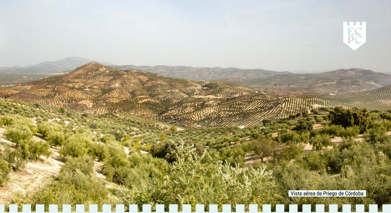
Vista aérea de Priego de Córdoba